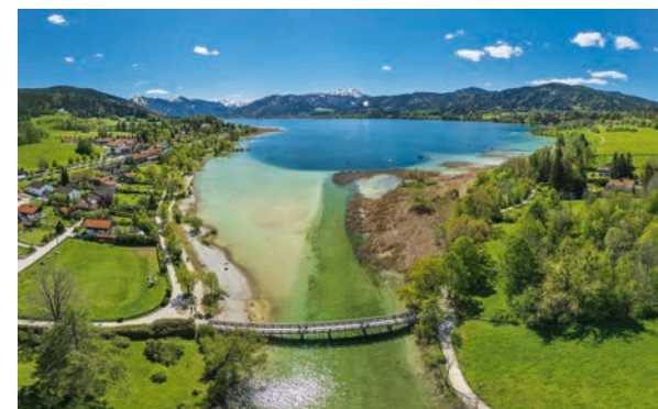
Bild unten I Auch Bad Tölz ist einer der Etappenorte.