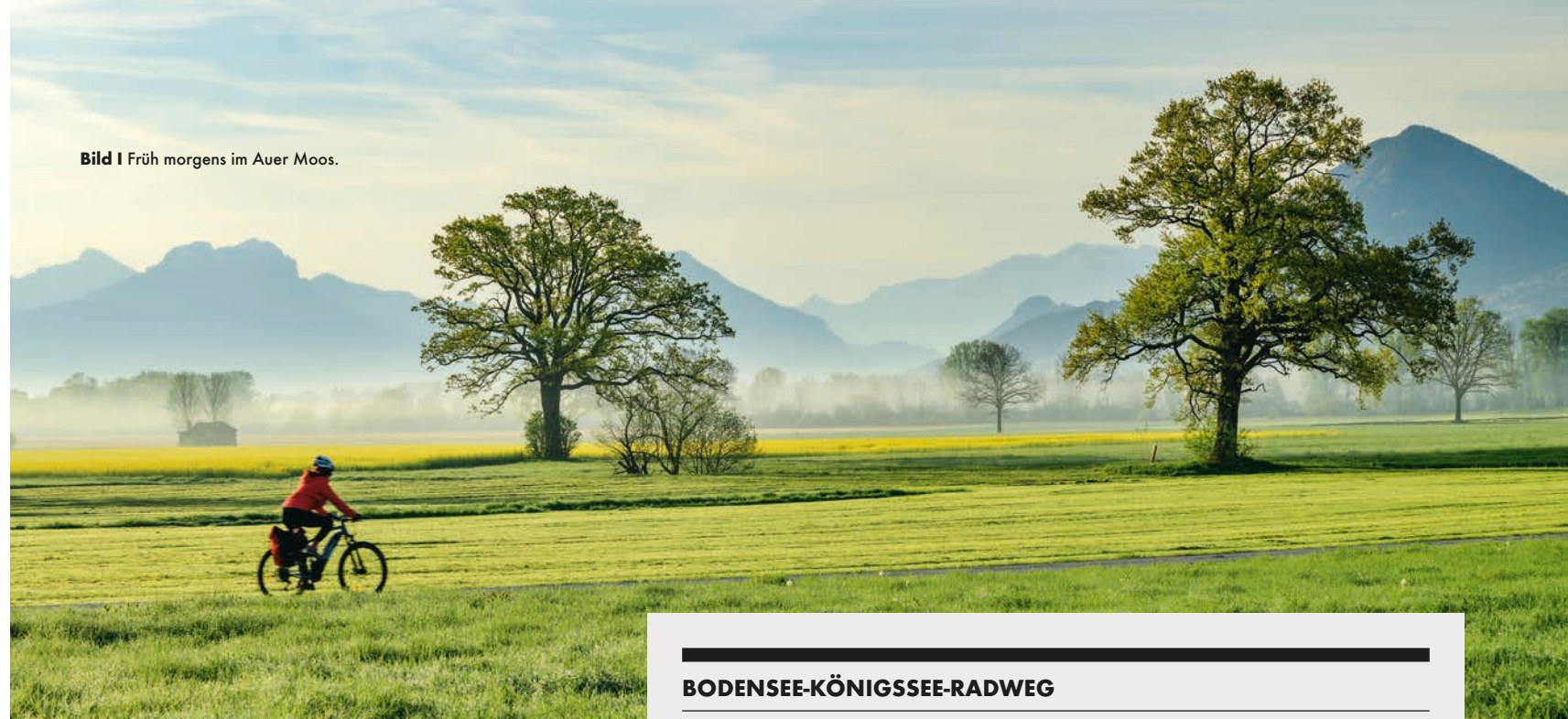
Bild I Früh morgens im Auer Moos.