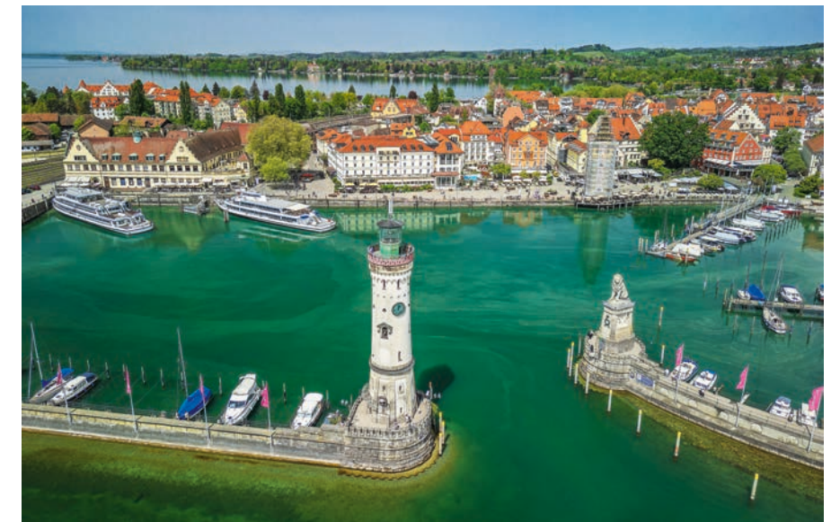
Bild oben Mitte | Stille genießen im Eglofstal. Bild oben | Am Bodensee in Lindau ist der offizielle Startpunkt der Tour.

wir haben noch einen tollen Abschlussstag vor uns. Ein erster Höhepunkt wird der Weg durch die Filzen bei Gaißach. So schöne Blicke! Der zweite Höhepunkt wird der Kirschkuchen vom Cafe Wagner in Gmund am Tegernsee. Das dritte Highlight werden die Kindheitsbilder in meinem Kopf sein, wenn wir am Schliersee vorbeiradeln. Und der letzte Höhepunkt wird der Moment sein, wenn wir in Niklasreuth die lange Abfahrt beginnen und bald der Blick auf den heimatlichen Kirchturm frei wird. Angekommen! ◀