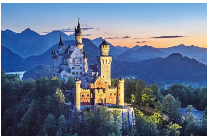
Bild oben I Bei Höglwörth unter dem Hochstaufen ist man bereits fast am Ziel. Bild Mitte I Neuschwanstein ist ganz sicher einer der Höhepunkte. Bild links I Seitenwechsel – auf die Ostseite des Inns.