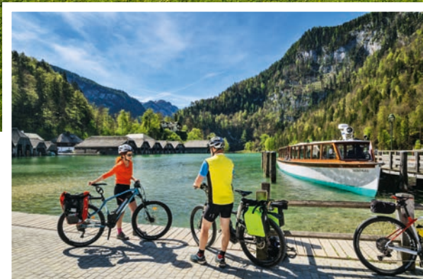
Bild oben I Der Weg führt an der Königsseer Ache entlang. Bild Mitte I Angekommen! Am Königssee. Bild links unten I Am Tegernsee gibt es einen herrlichen Bergblick. Und Kirschkuchen.